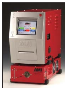
Con unidad de refrigeración integrada

El modelo 307 constituye la más avanzada fuente de energía para soldadura orbital de tubo de su clase en el mundo. Resulta económico, es fácil de usar, está equipado con aplicaciones útiles, compatible con las nuevas y antiguas cabezas de soldadura de fusión AMI, así como con algunas cabezas que cuentan con alimentación de alambre. El software es de formato Windows, siendo por tanto, compatible con PC, y encontrándose disponible en múltiples idiomas. Una pantalla táctil en color de 6,5" (16.5 cm) hace que la introducción de datos resulte cómoda y fácil. La disquetera y el puerto USB facilitan un almacenamiento simple y cómodo de las planificaciones de soldadura y los datos de los proyectos. Entre sus múltiples características se encuentran los desarrollos de los programas de soldadura automática y por puntos, programando por hora y/o posición, múltiples registros de datos de soldadura en la biblioteca, interfaz gráfica de usuario y sistemas de ayuda en pantalla.